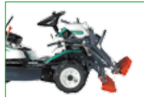
フォーク・バケット 角度調整可能