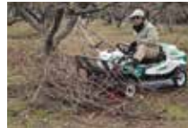
剪定枝のらくらく回収

取付可能機種 RM883X, 953X, 983X, RMT110 RMK151X, 180X コード No.0343-80000 RM983FX コード No.0347-80300