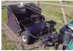
落葉が張り付いた圃場に